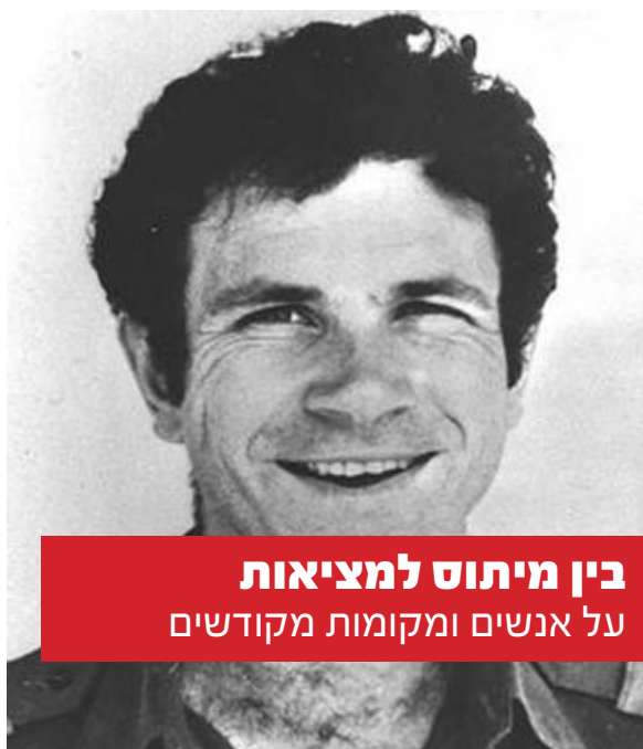
בין מיתוס למציאות על אנשים ומקומות מקודשים