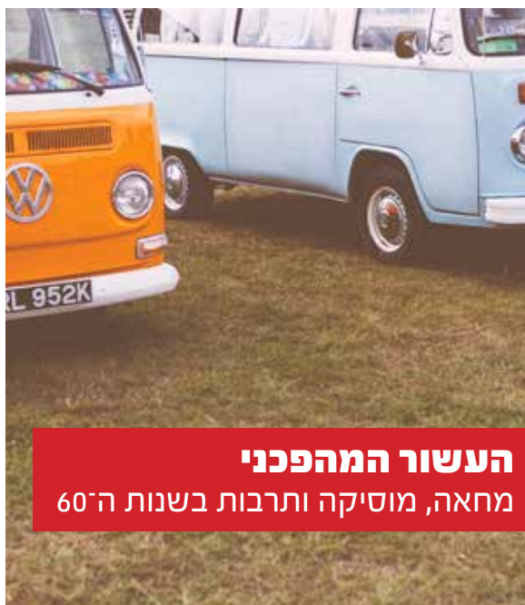
העשור המהפכני מחאה, מוסיקה ותרבות בשנות ה־60