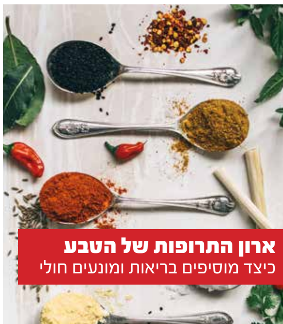
ארון התרופות של הטבע כיצד מוסיפים בריאות ומונעים חולי