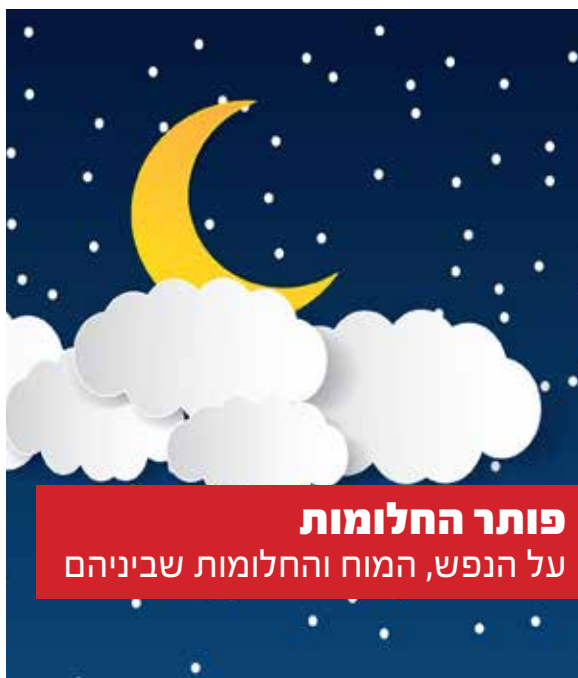
פותר החלומות על הנפש, המוח והחלומות שביניהם